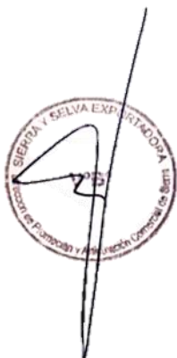
CUADRO DE MÉRITOS

El Cuadro de Méritos se elaborará solo con aquellos candidatos que hayan aprobado todas las Etapas del Proceso de Selección: Postulación Virtual y Revisión de Cumplimiento de Requisitos, Evaluación de Conocimientos, Verificación Curricular y Entrevista Personal.